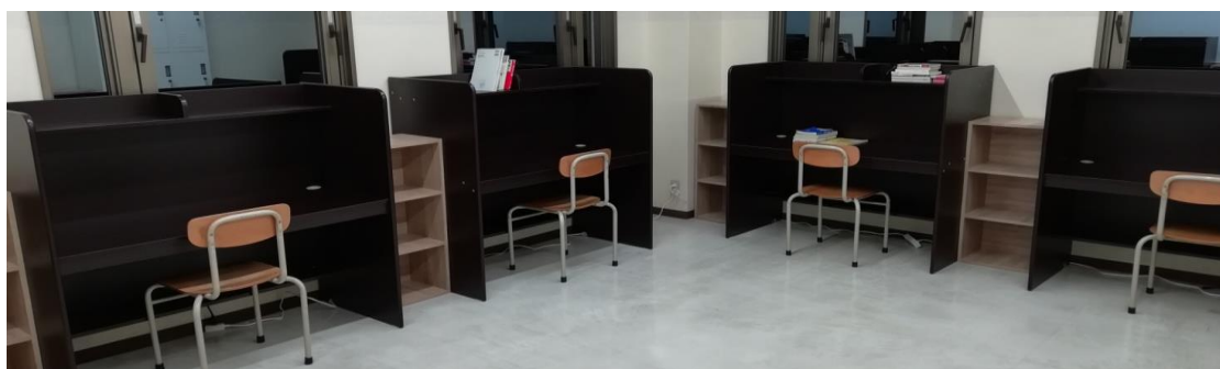
大学受験科個別ブース

コンサルタント大学受験科では一人一つの学習スペースが与えられます。共有スペースではなく、個別の学習環境があることで腰を据えて学ぶことができます。休憩室・資料室なども準備されており、必要に応じて利用することができます。朝9時から夜10時まで学習室を利用できます。勉強漬けの毎日を送ることができます。